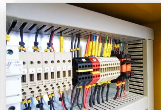
Imagen con finalidad ilustrativa únicamente.