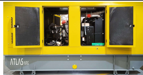
Imagen con finalidad ilustrativa únicamente.

Refrigerado por Agua Trifásico 50 Hz Diesel