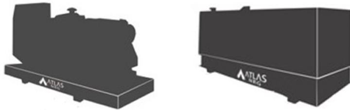
Imagen con finalidad ilustrativa únicamente.